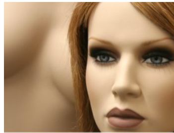
Kopf: 390 / Perücke: NWL: 640